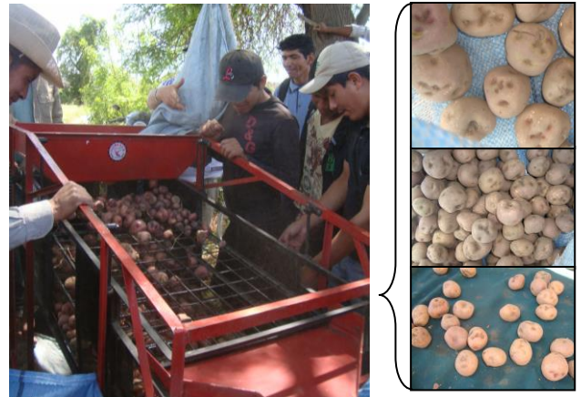
Clasificadora de Papa ayuda a seleccionar la papa.