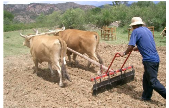
Nivelación de terrenos, preparando cama de semillas