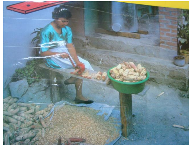
La desgranadora manual, son ideales para pequeños agricultores de maíz