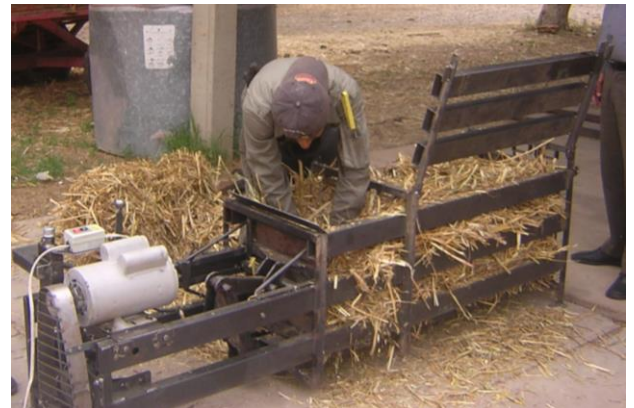
Enfardadora H-D, la alimentación de la máquina es rápida y sencilla