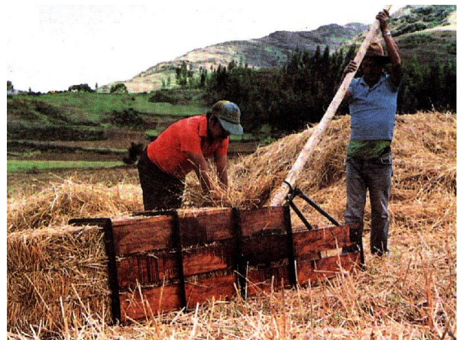
Elaboración de heno de rastrojo de trigo