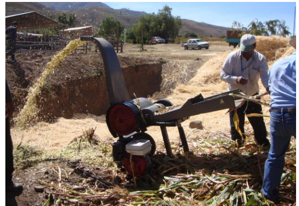
Picadora P-80, Ideal para pequeños y medianos productores de leche