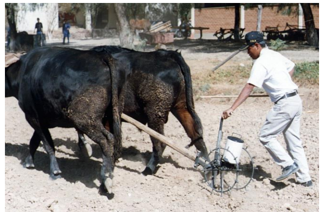
Sembrando maíz, directamente con la yunta de bueyes, utilizando la sembradora de granos CIFEMA