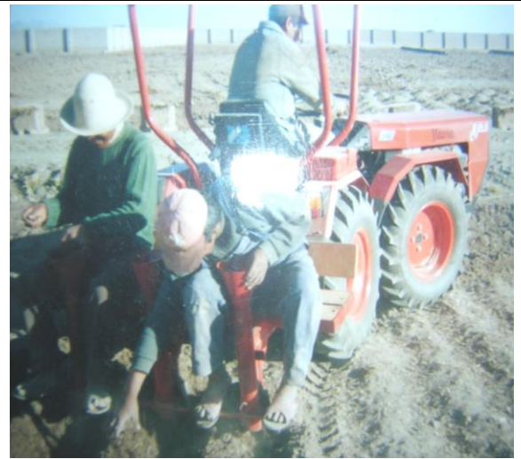
Al trabajar con la sembradora, la distribución de semilla es forma manual con tres operadores.