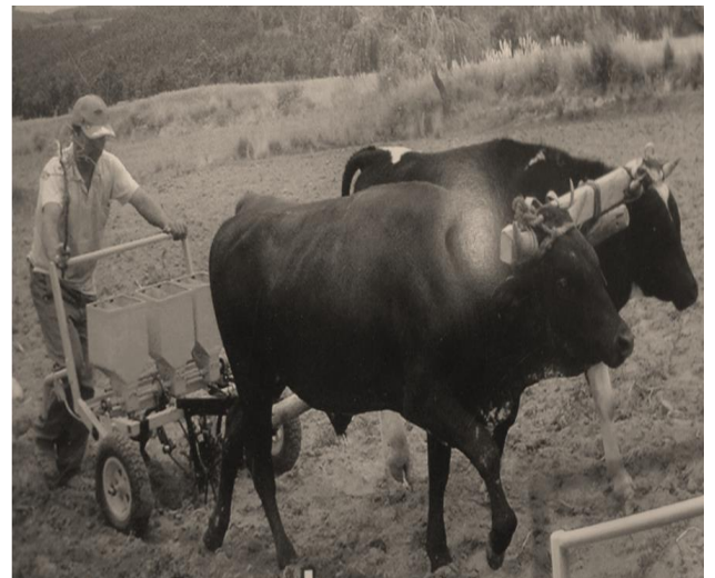
Al trabajar con la sembradora se siembra y se fertiliza al mismo tiempo tres surcos