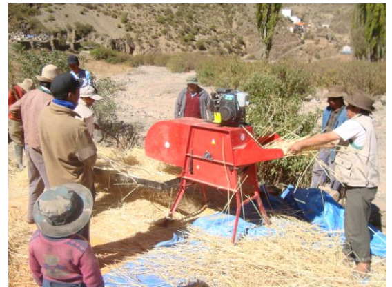
Trilladora T-1, el material trillado es cernido, para separar la paja del trigo