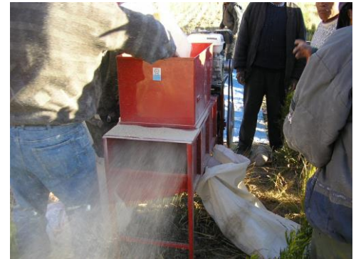
Venteadora V-1, limpia los granos de tierra, paja, piedras y otras impurezas